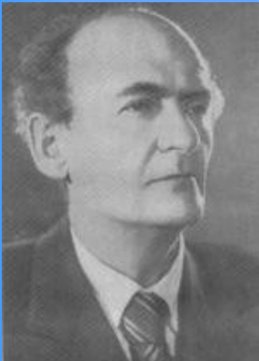
Рувим Исаевич ФРАЕРМАН (1891 -1972)