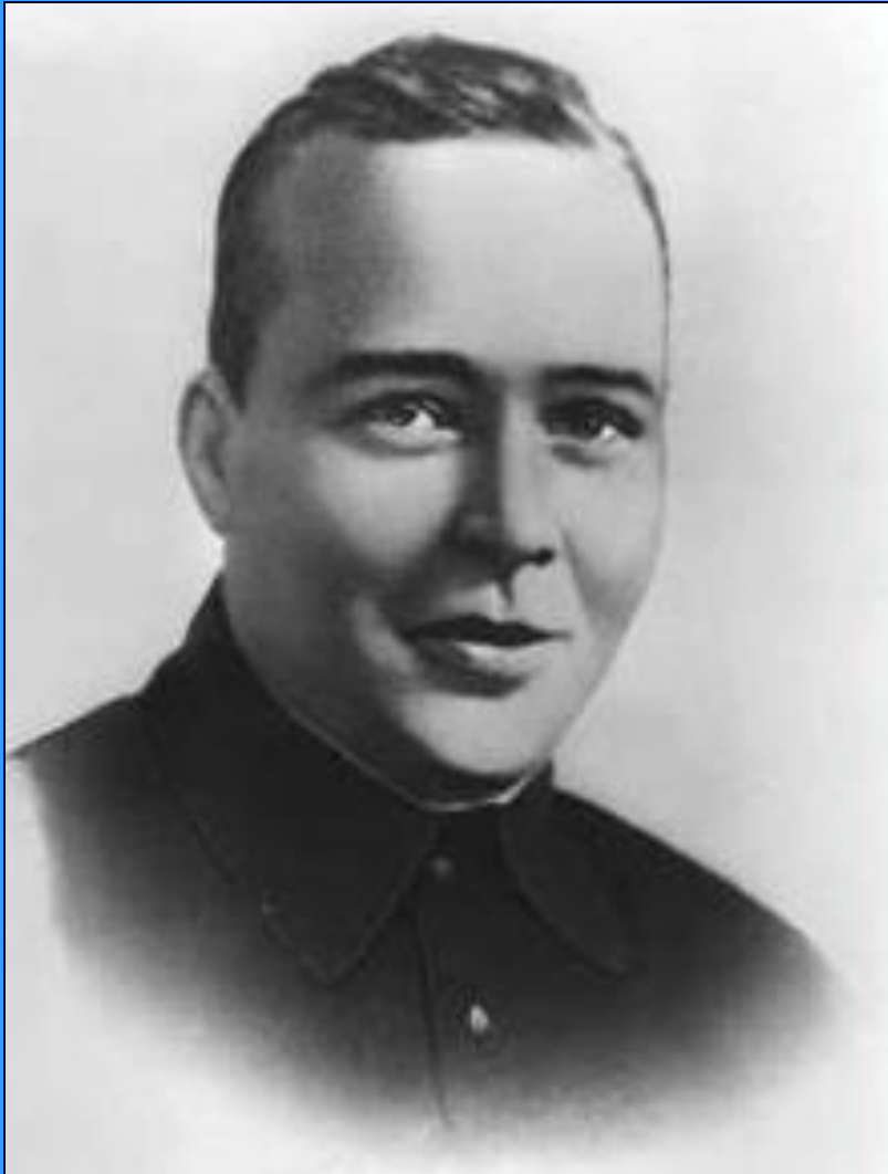
Аркадий Петрович ГАЙДАР

«Любимых детских книг творец И верный друг ребят, Он жил, как должен жить боец, И умер как солдат.»